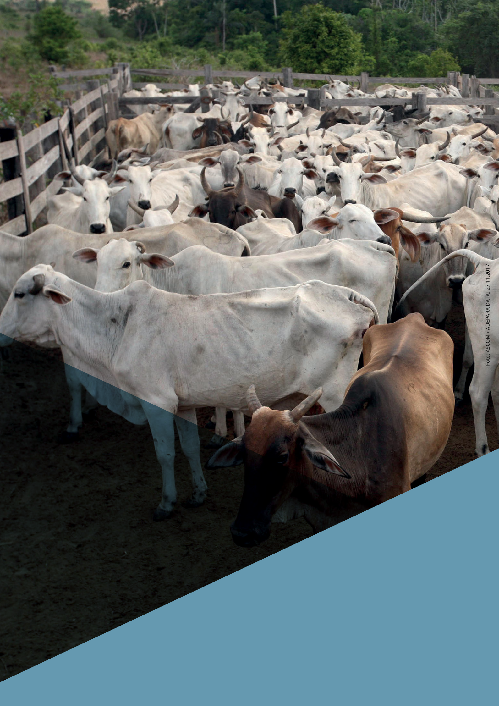
DATA: 27.11.2017